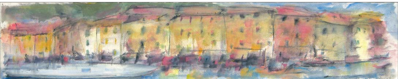
Dellavite Giuliano Meriggio al porto