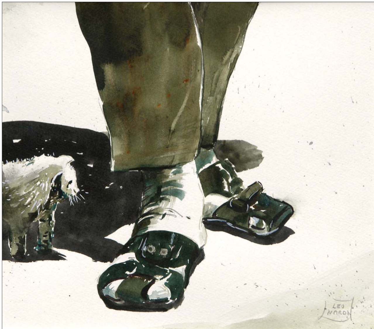
Leonardi Luigi Il piccolo amico