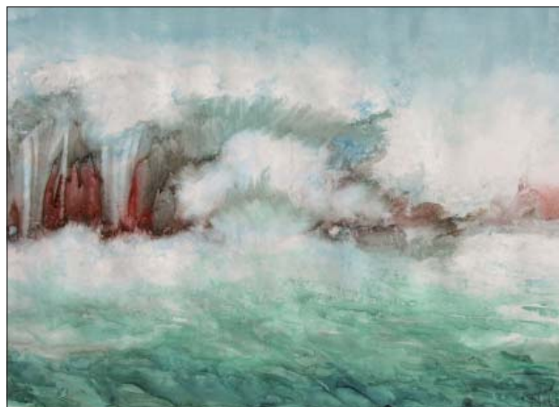
Sisti Francesca Avventure nell'universo