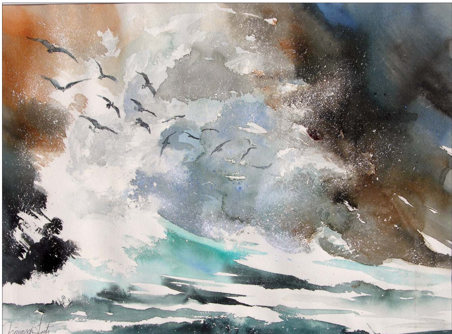
Sisti Francesca Ostentazione di sicurezza