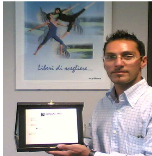
Coreografo Platinum ballet