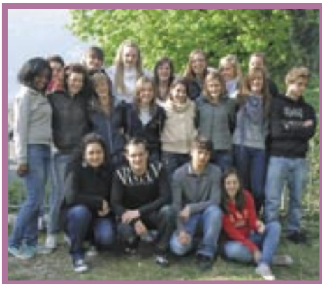
Realizzato da: 4B TURISMO ISTITUTO ANDREA FANTONI-Clusone (BG) anno 2010/2011